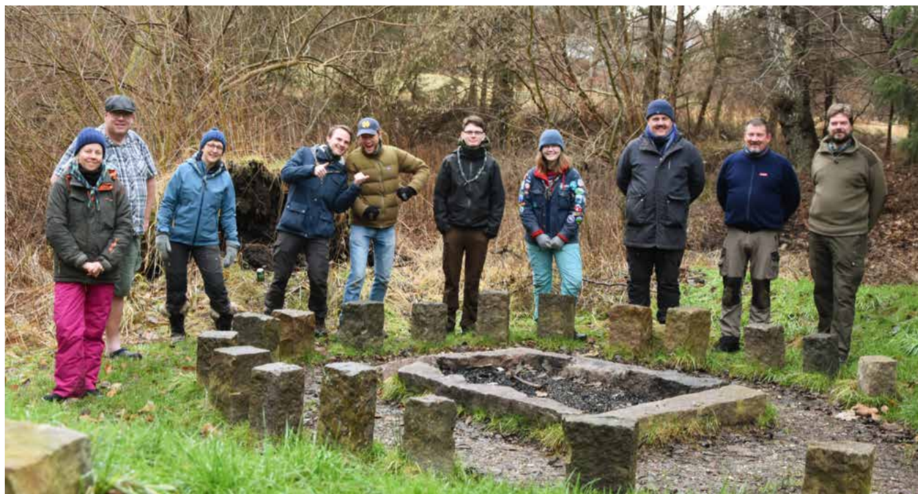
Fra gruppens leder- og planlægningstur i januar 2022 på Reden ved Fredensborg

Vi kunne som spejdergruppe nok vokse og tilbyde spejd til endnu flere børn og unge. Men vi skal også kunne følge med - det skal give mening. I bestyrelsen fortsættes arbejdet for en ny hytte, og dermed kan vi måske også tænke nyt i fremtiden og måske få afskaffet ventelisterne, men vigtigst af alt er, at vi trives som gruppe.