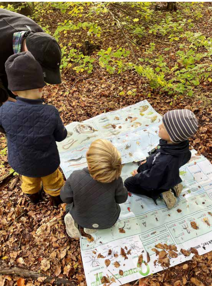
Året der gik 2022 - Blushøjspejderne - Det Danske Spejderkorps

naturens elementer), Halloweengræskar og i december lavede vi julekrea, hvor spejderne lavede julenisser ud af små stykker træ, lim, filt og lidt maling.